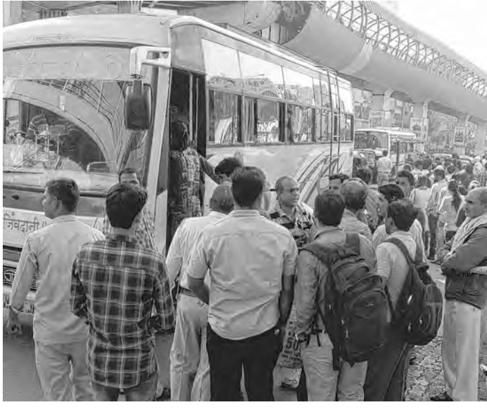
मध्यरात्रीपासून वेस्ट कर्मचारी संपावर गेल्याने मंगळवारी मुंबईकरांचे प्रचंड हाल झाले. प्रवासासाठी खाजगी बसचा पर्याय काहींनी स्वीकारला. तर एखादी रिक्षा मिळणेही प्रवाशांना कठीण बनले होते. बाहेरगावाहून आलेल्या लोकांना आपल्याकडील अवजड सामान सांभाळत काही वाहन मिळते का हे पाहण्यासाठी बरीच मेहनत घ्यावी लागली.

कल्याणमित्र होता येणे वाटते तेव्हादे अवघड नक्की नाहीय, त्यासाठी तुम्हाला खरंतर काहीच लागत नाही! लागतात फक्त सद्भावना, दुसऱ्यांचे दुःख, त्रास समजून घेण्याची क्षमता आणि सहज पुढे करता येणारा मद्दतीचा हात. (क्रमशः)