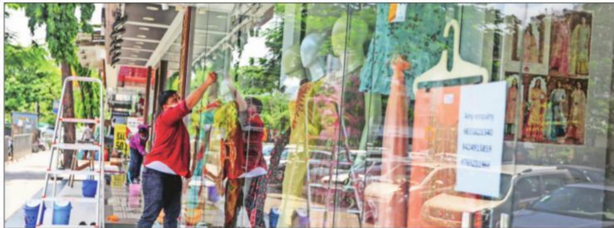
At a shop in Vashi, Navi Mumbai, on Tuesday. Non-essential shops were allowed to open on alternate days. Narendra Vaskar